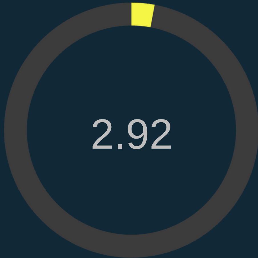
Retorno Social sobre Inversión

Por cada peso invertido se devuelve 1.21 pesos a la ciudad