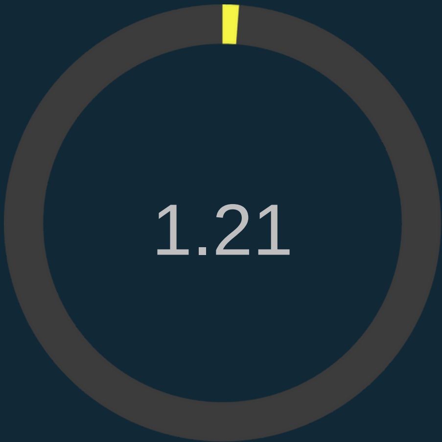
Índice de Valor Social (IES)

Por cada peso invertido se devuelve 1.21 pesos a la ciudad